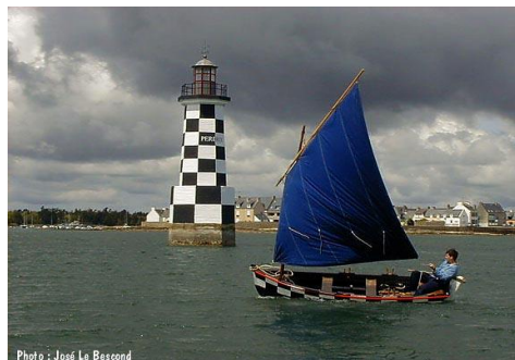
Le Phare des Perdrix à Loctudy